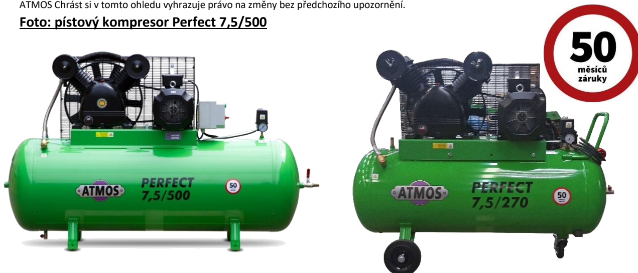
Foto: pístový kompresor Perfect 7,5/500

(4) Záruka (délka i podmínky) se vždy aktuálně řídí výlučně podmínkami uvedenými v originální dokumentaci dodané současně se strojem! ATMOS Chrást si v tomto ohledu vyhrazuje právo na změny bez předchozího upozornění.